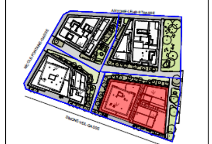
Übersicht Bauteil: D Untergeschoss