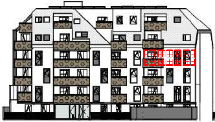
ANSICHT SÜD GARTEN SCHROTTENSTEINGASSE 6