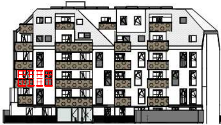
ANSICHT SÜD GARTEN SCHROTTENSTEINGASSE 6