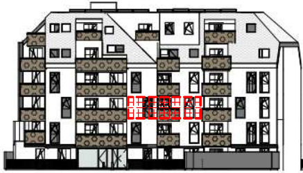
ANSICHT SÜD GARTEN SCHROTTENSTEINGASSE 6