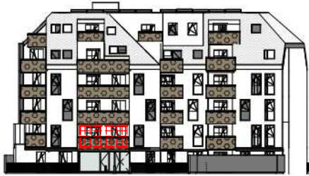
ANSICHT SÜD GARTEN SCHROTTENSTEINGASSE 6