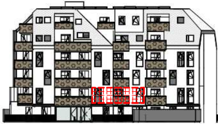
ANSICHT SÜD GARTEN SCHROTTENSTEINGASSE 6