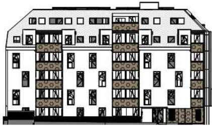
ANSICHT NORD STRASSE SCHROTTENSTEINGASSE 6