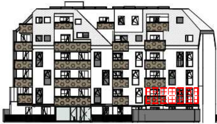
ANSICHT SÜD GARTEN SCHROTTENSTEINGASSE 6