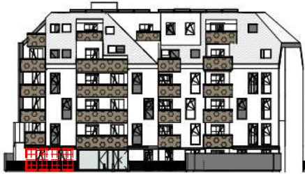
ANSICHT SÜD GARTEN SCHROTTENSTEINGASSE 6