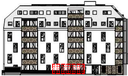
ANSICHT NORD STRASSE SCHROTTENSTEINGASSE 6