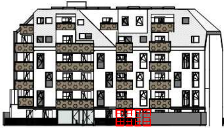
ANSICHT SÜD GARTEN SCHROTTENSTEINGASSE 6