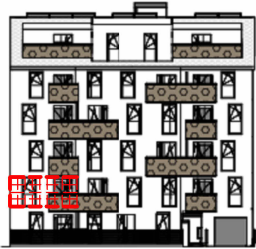
ANSICHT SÜD GARTEN SCHRICKGASSE 23 / STIEGE 2