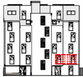
ANSICHT NORD STRASSE SCHRICKGASSE 23 / STIEGE 2