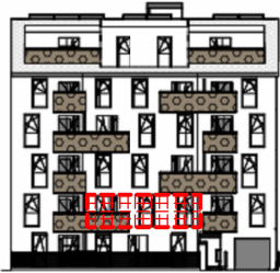
ANSICHT SÜD GARTEN SCHRICKGASSE 23 / STIEGE 2