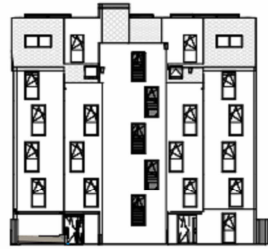
ANSICHT NORD STRASSE SCHRICKGASSE 23 / STIEGE 2