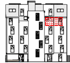
ANSICHT NORD STRASSE SCHRICKGASSE 23 / STIEGE 2