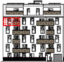
ANSICHT SÜD GARTEN SCHRICKGASSE 23 / STIEGE 2