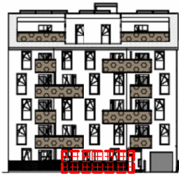
ANSICHT SÜD GARTEN SCHRICKGASSE 23 / STIEGE 2