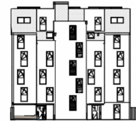
ANSICHT NORD STRASSE SCHRICKGASSE 23 / STIEGE 2