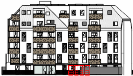
ANSICHT SÜD GARTEN SCHROTTENSTEINGASSE 6 / STIEGE 1