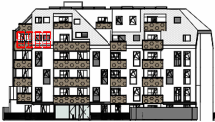
ANSICHT SÜD GARTEN SCHROTTENSTEINGASSE 6 / STIEGE 1