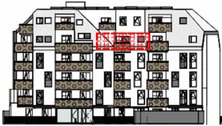
ANSICHT SÜD GARTEN SCHROTTENSTEINGASSE 6 / STIEGE 1