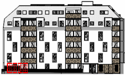
ANSICHT NORD STRASSE SCHROTTENSTEINGASSE 6 / STIEGE 1