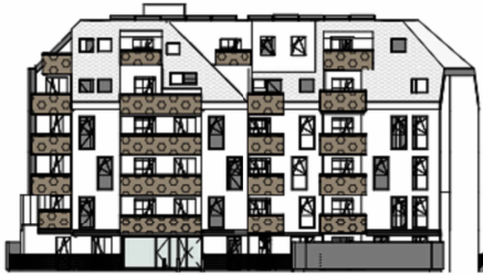
ANSICHT SÜD GARTEN SCHROTTENSTEINGASSE 6 / STIEGE 1