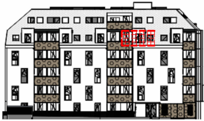
ANSICHT NORD STRASSE SCHROTTENSTEINGASSE 6 / STIEGE 1