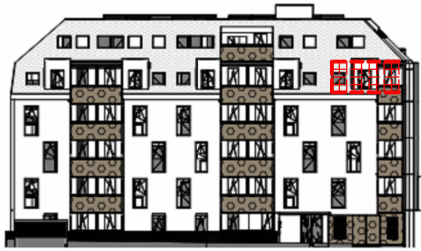
ANSICHT NORD STRASSE SCHROTTENSTEINGASSE 6 / STIEGE 1