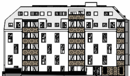
ANSICHT NORD STRASSE SCHROTTENSTEINGASSE 6 / STIEGE 1