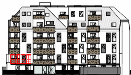
ANSICHT SÜD GARTEN SCHROTTENSTEINGASSE 6 / STIEGE 1