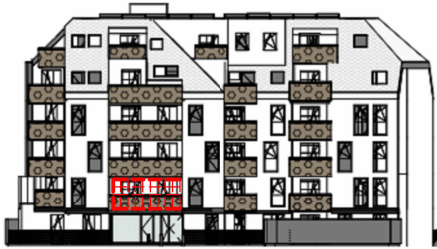
ANSICHT SÜD GARTEN SCHROTTENSTEINGASSE 6 / STIEGE 1