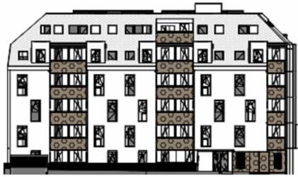
ANSICHT NORD STRASSE SCHROTTENSTEINGASSE 6 / STIEGE 1