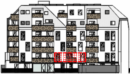
ANSICHT SÜD GARTEN SCHROTTENSTEINGASSE 6 / STIEGE 1