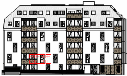
ANSICHT NORD STRASSE SCHROTTENSTEINGASSE 6 / STIEGE 1